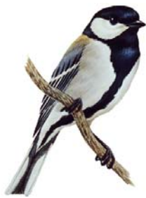
市の鳥・シジュウカラ