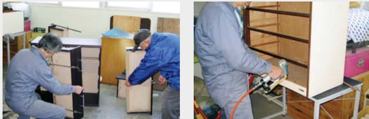
シルバー人材センターの職人さんが直しています

「緑確保の総合的な方針(案)」の公表及び意見募集 減少傾向にある樹林地や農地等の既存の緑を将来に引き継いでいくための施策を明らかにするため、昨年来、都区市町村が合同で「緑確保の総合的な方針」の策定に向けて検討を進めてきました。