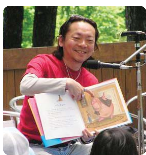
パパも読み聞かせに挑戦!

小型犬用仮設ドッグランを設置し、愛犬クラブ独自のファミリードッグ検定を行います。また、ドッグトレーナーが来場し、愛犬への接し方を学びます。