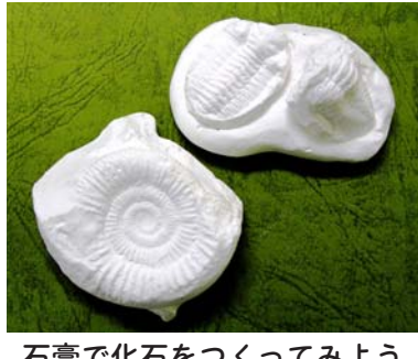
石膏で化石をつくってみよう