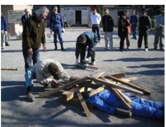
町会合同での防災訓練の様子

万が一、災害が発生した場合には、地域住民がまとまって行動することが最も重要です。