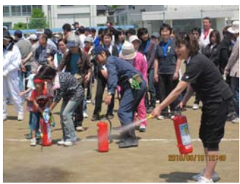
永田町会運動会での消火訓練の様子

町会・自治会では、自主防災組織を結成し、地域の安全安心を守る活動を行なっています。災害時には、初期消火活動、被災者の救出や避難誘導などの役割を担います。