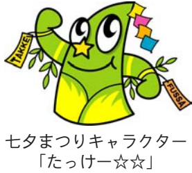
七夕まつりキャラクター「たっけー☆☆」