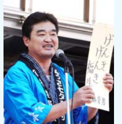
第60回福生七夕まつりにて