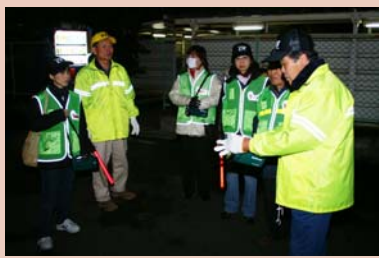
防犯パトロールの様子

安全で安心なまちを目指して 近ごろ、幼児・児童を狙う事件や、空き巣狙いやひったくりなど、身近なところでの犯罪の発生が多くなっています。