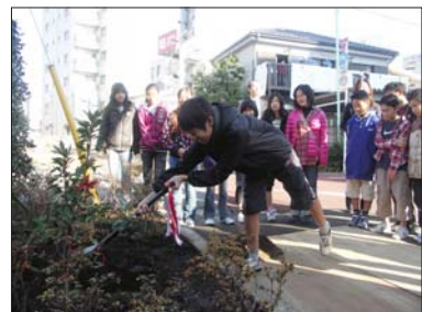
植樹をする児童たち

児童たちは、昨年の「福生七夕まつり」で市民模擬店を出店、その収益金を何らかの役に立たせたいと、去る12月18日(土)にみかんの木を寄贈してくれました。