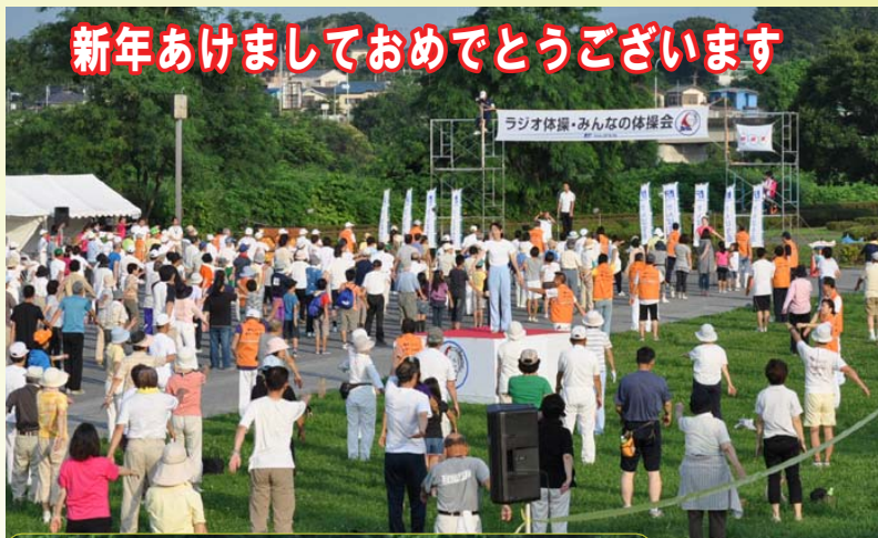
新年あけましておめでとうございます

2面 住民基本台帳カードの交付等の際の本人確認方法がわかります 3面 市の計画に対する市民の皆さんからの意見を募集します 4面 ふっさ環境フォーラム 5面 課税課からのお知らせ 6面 新型インフルエンザのワクチンを接種された方へ 8面 新春企画 年男・年女