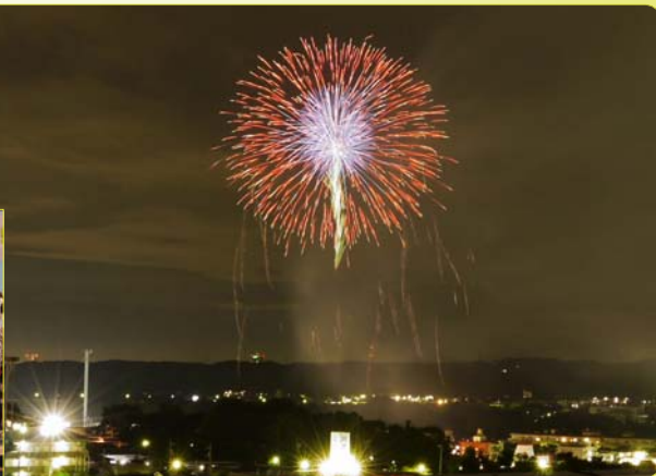
11年ぶりに打ち上げ花火も復活しました。

❑年が明け寒さが増してきましたが、山並みが綺麗に見える季節となりました。天気の良い日は元気を出して散歩でもしながら山々を眺めてみませんか。❑