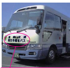
代車には「福生市福祉バス」と書いてあります

福祉バスの車検手続きに伴い、代車による運行となります。通常と違う車両(写真)で運行しますので、お間違えないようお願いいたします。