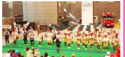
2010丸の内キッズフェスタでの演奏

【消防少年団とは】防火・防災に関する知識・技術を身に付けるとともに、規律ある団体活動や奉仕活動を通して、社会の基本的なルールをきちんと守り、思いやりの心を持った責任感のある大人に育つよう、日々の活動に取り組んでいます。