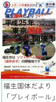
福生国体だより「プレイボール」

平成23年度は、国体PR事業の推進、平成24年度に実施する成年女子ソフトボールリハーサル大会の準備をします。