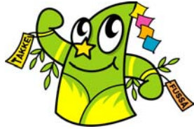
七夕まつりキャラクター「たっ(けー☆☆)」