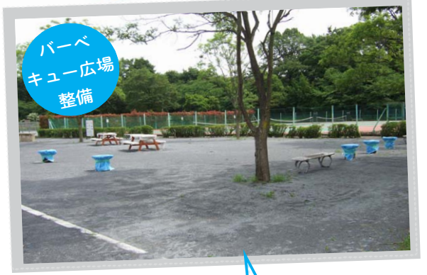
バーベキュー広場整備

かまど7基、ベンチ4基、テーブルベンチ2基を新設し利用者の利便性の向上に配慮しました。