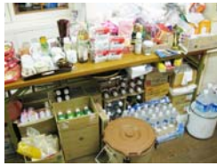
避難所内部の様子。避難者と寝食をともにし、避難所の支援にあたりました。