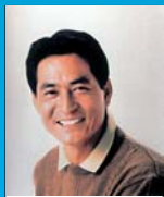
中畑 清氏

元プロ野球選手・中畑清さんが七夕まつりに登場!現役時代のとおきのお話やプロ野球選手愛用のアイテムをオークションで販売し、売り上げを被災地の少年野球チームへ