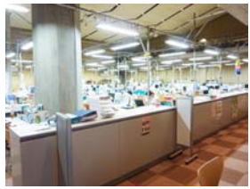
浪江町臨時役場の様子