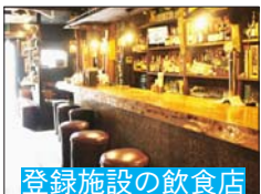
登録施設の飲食店

問合せ 福生ロケーションサービス事務局(シティセールス推進課) ☎551・1699