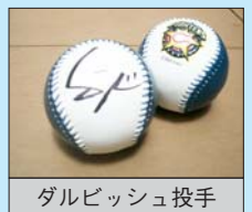
ダルビッシュ投手