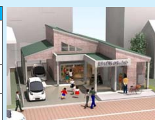
▲メインステーション完成予想図 ▲拠点整備内容

事業の進捗状況等については、今後、広報ふっさや市ホームページでお知らせします。皆様のご理解とご協力をお願いします。