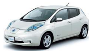
電気自動車に触れてみよう!

市内イベントにPRブースを設置します! 電気自動車や電動アシスト自転車に触れてみませんか?