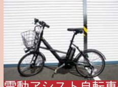
電動アシスト自転車

電気自動車と電動アシスト自転車をみんなで「共同使用(シェアリング)」し、地球に優しいまちづくりや地域の活性化などを目指していくこの実証実験は、平成24年1月から開始予定です。今後も市内イベント等にブースを出展して、PR活動を実施していきます。なお、本事業は市からウインド・カー株式会社へ委託をして行なっています。