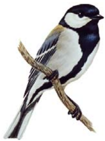
市の鳥・シジュウカラ