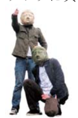
▲大仏のお面がトレードマーク