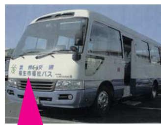
代車には「福生市福祉バス」と書いてあります。