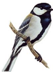
市の鳥・シジュウカラ