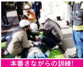
本番さながらの訓練!

1月29日、加美平団地自治会では、日ごろから災害に備えるため、防災訓練を行いました。