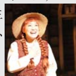
(前回公演より)