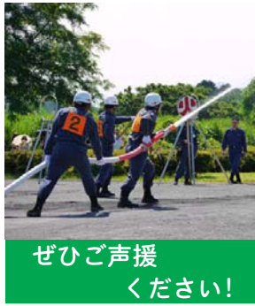
ぜひご声援ください!

半世紀以上の歴史を持つ審査会にお越しくください。日時 5月27日(日)午後0時30分 場所 多摩川中央公園