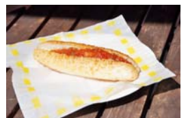
ブレッダガーデン

問合せ 大多摩観光連盟 ☎0428・22・3525、(福生ドッグに関する問合せ)商工会 ☎551・2927