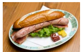
シュトゥーベン・オータマ

福生市のホームページアドレスは http://www.city.fussa.tokyo.jp/ です