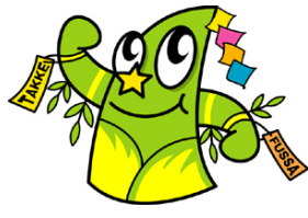
七夕まつりキャラクター たっけー☆☆