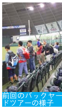
前回のバックヤードツアーの様子

さらに、今回も先着150名の方を、普段は見られない選手の練習風景などを見学できるバックヤードツアーにご招待！