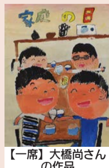
【一席】大橋尚さんの作品