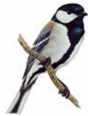
市の鳥・シジュウカラ