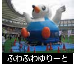
ふわふわゆりーと