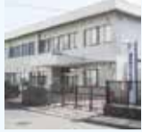
子ども家庭支援センター (子ども応援館1階)

親子で遊びながら交流できるスペースです。ボールプールや玩具、絵本等があります。開所時間内でご自由にご利用ください。