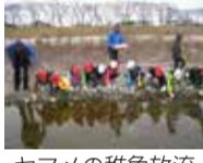
ヤマメの稚魚放流

今年度は、第二・第三・第五・第六・第七小学校に卵を配布しました。(放流された稚魚は、各校の児童が卵からふ化させ、放流の