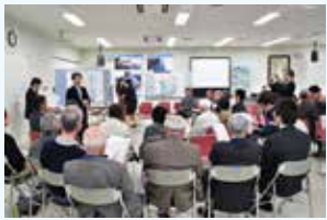
昨年のフォーラムの様子

これまでまちづくり景観推進連絡会と市が協働し、福生の景観を改善するために活動をしてきました。フォーラムに参加して、「福が生まれるまち福生」の今後のまちづくりについて一緒に考えてみませんか?