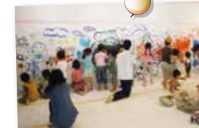
くくるみるふっさ3月イベント「みんなで楽しいイブペイント」の様子

国道16号線沿いの「アートギャラリー」で壁に自由に絵を描くイブペイントを体験していただく人気のイベント。