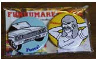
福生まれ缶バッジ