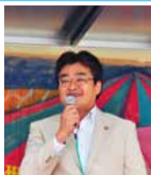
銀座商栄会 アート祭にて

それ以来、わが家の夏の楽しみが一つ増えました。通りかかったら、ぜひ覗いてみてください。