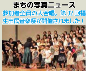
まちの写真ニュース 参加者全員の大合唱。第32回福生市民音楽祭が開催されました！

今号の主な記事 2面 個人住民税の「還付加算金」の支払い不足について 5面 子育て世帯臨時特例給付金・臨時福祉給付金の申請受付が始まりました 6面 お持ちですか？「ふっさ子育てまるとくカード」 7面 中央体育館スポーツ教室に参加しよう！ 8面 松林分館の夏休み子ども教室