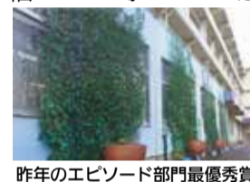
昨年のエピソード部門最優秀賞