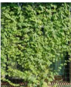
昨年のみどりのカーテン部門最優秀賞

ゴーヤ等のツル性の植物で作ったカーテンの写真等で、コンテストを行います。育てていただいた植物の写真とエピソード・アピールをお待ちしています。