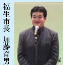
福生市長 加藤育男 平和のつどいにて