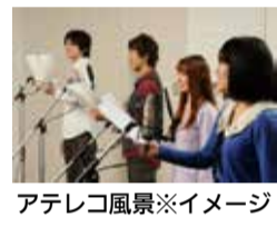
アテレコ風景※イメージ

【出演団体】▼福生第三・六・七小学校 ▼福生第一・二・三中学校 ▼福生吹奏楽団(友情出演) 【問合せ】教育委員会指導室学務・指導係 ☎ 551・1948