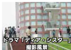
ドラマ「ディア・シスター」撮影風景

テレビや映画を見ていて、「この景色見たことある！」とハッとしました。これはありませんか？市には、ドラマや映画の舞台として使われる魅力的な施設や景色が数多くあります。放映情報は、ふっさ情報メールや福生ロケーションサービス（http://fussafilm.com）で随時紹介していますので、ぜひご覧ください。