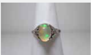
公売物件の一例(指輪×メキシコオパール付き)