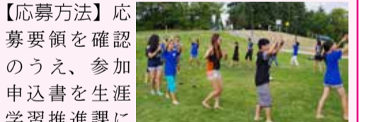
シアトルの現地学生との交流の様子

【応募方法】応募要領を確認のうえ、参加申込書を生涯学習推進課に提出してください(郵送不可)。応募要領や参加申込書は市内各中学校及び市役所第二棟2階生涯学習推進課にあります。