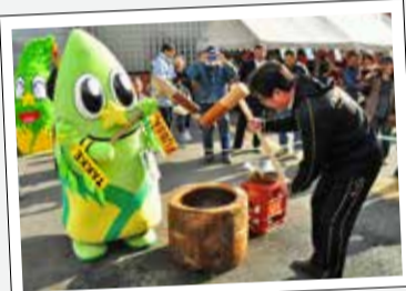
【問合せ】シティセールス推進課まちの魅力創造グループ ☎ 551・1740

★1月17日に福生のお米でお餅つき！ 学童クラブ主催の新春親子お楽しみ会で、福生に唯一残る田んぼで作った「あくねもち」という「もち米」を使って、餅つきをしてみました。お餅は、参加した皆さんと一緒に、おいしくいただきました。