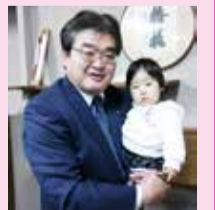
ふっさっ子とともに