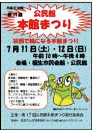
公民館本館まつりポスター

●ボランティア募集 いっしょにまつりを運営していただけるボランティアスタッフを募集します。経験などは問いません。 【内容】①模擬店部門→当日の調理、洗い物 ②演示部門→会場整理・進行補助 ③展示部門→会場の片付け等 ④子ども遊び部門→スタンプラリー受付※半日単位でお願いします。詳細は後日、ご説明します。 【対象】高校生以上の方(子ども遊び部門のスタンプラリーは中学生以上) 【申込み】6月30日(水)午後5時までに公民館事務所 ☎ 552・2118 へ。