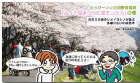
トレインチャンネルイメージ画像

「経済産業省平成27年度補正予算 ものづくり・商業・サービス新展開支援補助金説明会」を開催します!