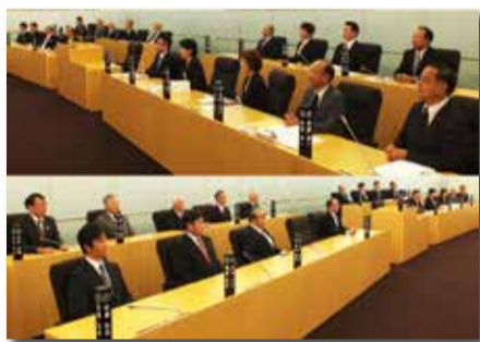
福生市議会の様子